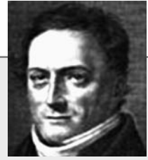
Johann Friedrich Herbart

Filósofo y pedagogo alemán. (1776-, 1841) Estudió en Suiza los métodos de Pestalozzi. Fue profesor en Gotinga y en Königsberg, donde sucedió a Kant. Es autor de Pedagogía general (1806), La psicología como ciencia (1824-1825) y Metafísica general (1828-1829) Herbart fue el primero en definir la Psicología como una ciencia separada de la Filosofía y la Fisiología, y en otorgar a la Pedagogía un estatus científico. Su contribución más destacada consistió en formular una teoría del aprendizaje, a la que denominó “Teoría de la Apreciación”, a partir de las leyes de asociación de Locke y de la doctrina de las facultades.